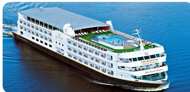
• Navio IberoStar